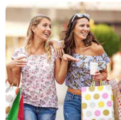
Shoppen in Arnhem of Apeldoorn