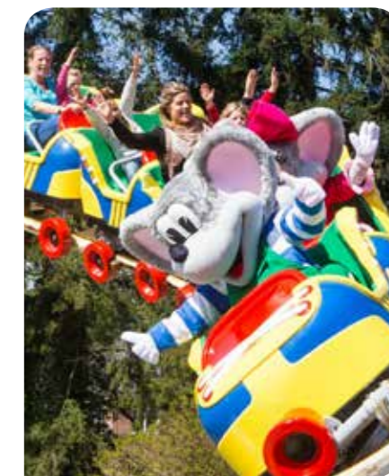
Kinderpretpark Julianatoren De leukste attracties, shows en evenementen voor jong en oud.