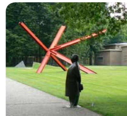
Kröller Möller museum Prachtige schilderijen van Gogh en één van Europa's grootste beeldentuinen.