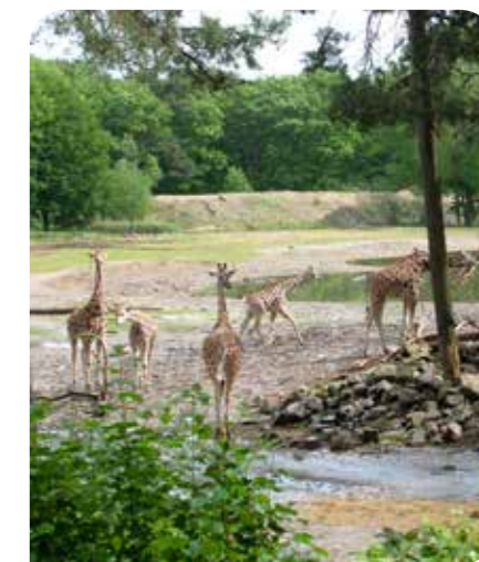
Burgers Zoo Arnhem Wandel door de safari, de bush en de desert. Ontdek de prachtige onderwaterwereld en 's werelds grootste overdekte mangrove!