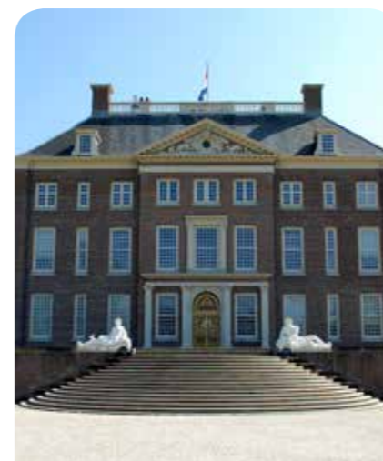
Paleis 't Loo De barokke paleistuinen zijn één van de mooiste van Europa en op het Stallenplein zijn historische auto's en rijtuigen te zien. Bezoek een van de vele evenementen en bekijk het uitzicht vanaf het paleisdak!